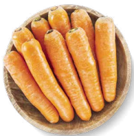
COHN FARMS CAROTTES GÉANTES

Transformation : entières Disponibles en : 5 lb, 10 lb, 25 lb et 50 lb