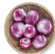
COHN FARMS OIGNONS ROUGES

Transformation : pelées Quantité : 50 à 110 Disponibles en : boîte de carton compostable et recyclable à 100 % Produit du Canada