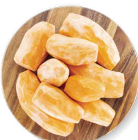
COHN FARMS POMMES DE TERRE DOUCES ENTIÈRES PELÉES

Transformation : entiers Disponibles en : boîte de 10 lb, sacs de 25 et 50 lb