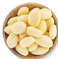
COHN FARMS POMMES DE TERRE BLANCHES ENTIÈRES PELÉES

Transformation : pelés Disponibles en : sac de 22 lb • Aussi disponibles : Colossal et d'Espagne