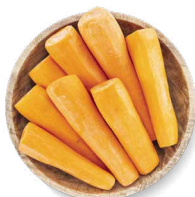
COHN FARMS CAROTTES GÉANTES

Transformation : entier Disponible en : emballages de 8-10 ou 12