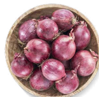
COHN FARMS OIGNONS ROUGES

Transformation : pelées Disponibles en : sac de 22 lb