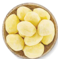
COHN FARMS POMMES DE TERRE YUKON ENTIÈRES PELÉES

Transformation : entiers Disponibles en : boîte de 10 lb, sacs de 25 et 50 lb • Aussi disponibles : Colossal et d'Espagne