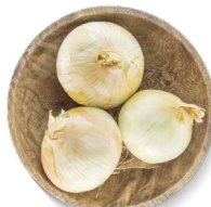
COHN FARMS OIGNONS À CUIRE

Transformation : pelées Disponibles en : sac de 22 lb