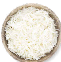
COHN FARMS POMMES DE TERRE RÂPÉES

Transformation : pelés Disponibles en : sac de 22 lb