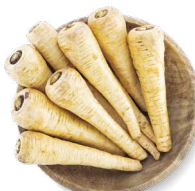
COHN FARMS PANAIS

Transformation : râpées Disponibles en : sac de 22 lb