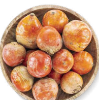
COHN FARMS BETTERAVES DORÉES

Transformation : entier Disponible en : emballages de 8-10 ou 12