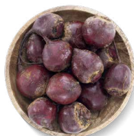
COHN FARMS BETTERAVES ROUGES

Transformation : entières Disponibles en : sacs de 5 et 25 lb