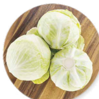
COHN FARMS CHOU VERT

Transformation : entières Disponibles en : 5 lb, 10 lb, 25 lb et 50 lb