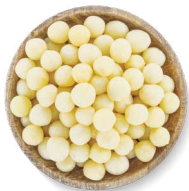
COHN FARMS POMMES DE TERRE PARISIENNES

Transformation : pelées Disponibles en : sac de 22 lb