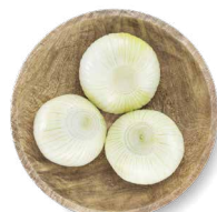
COHN FARMS OIGNONS À CUIRE

Transformation : pelées Disponibles en : sac de 22 lb