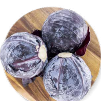
COHN FARMS CHOU ROUGE

Transformation : pelées Disponibles en : 5 lb, 10 lb, 25 lb et 50 lb